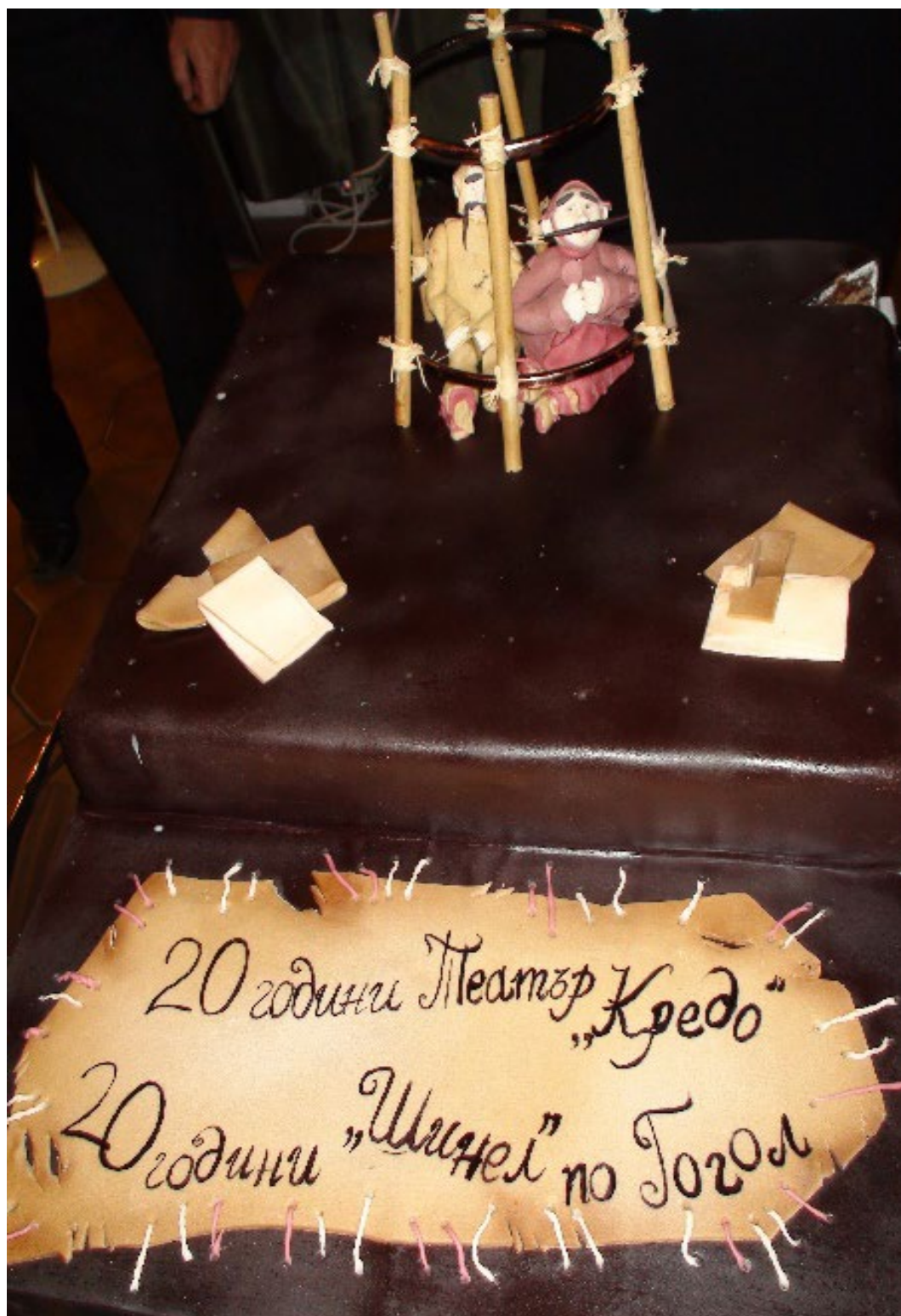
Специалната торта за 20-я юбилей на „Шинел“ и Театър „Кредо“ (2012)