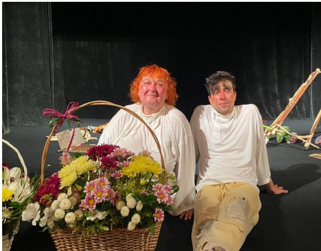
Фото моменти от юбилейното турне в България през 2022 година по случай 30-я юбилей на Театър „Крего“ и „Шинел“ по Гогол

През 2022 година отбелязват заедно 30-та годишнина на Театър „Крего“ и знаменития му спектакъл „Шинел“ по Гогол с национално юбилейно турне в страната, което се реализира с финансовата подкрепа на Национален фонд „Култура“. Навсякъде са посрещнати с дълги и бурни аплодисменти, такива, каквито винаги са разтърсвали залите в България и по света след този забележителен спектакъл-изключение в българския театър, каквото може да си мечтае да запише в биографията си всеки творец.