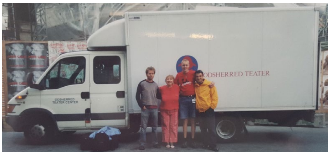
Камионът, с който пътува екипът на „Каквото направи дядо, Все е хубаво“ в Дания (2005)

Със специален камион по време на турнето в Дания, екипът на Театър „Кредо“, декорите, осветителната и озвучителна техника и конструкцията на сцената пътуват из цяла Дания.