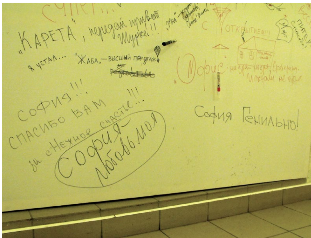
Зрителските отзиви за „Каквото направи дядо...“ на фестивала в Могильов, Беларус (2011)

През март 2011 година участието на Театър „Кредо“ на фестивала „М@ртконтакт“ в гр.Могильов, Беларус, се превръща в огромно събитие. Зрителските послания към Театър „Кредо“ и неговия спектакъл, написани на специално подготвената за зрителски отзиви „фестивална стена“, дават представа за вълнението на публиката от спектакъла : „Гениално!“, „София!!! Благодарим ви за СНЕЖНОТО щастие!!!“ „София – моя любов.“ Зрителите присъждат на спектакъла „Каквото направи дядо, все е хубаво“ своята награда – наградата на публиката.