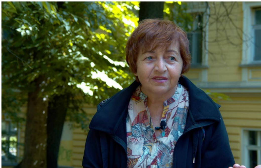
Светла Бенева, театрален критик и театровед